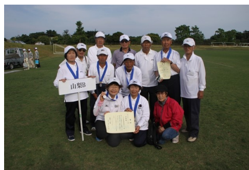
準優勝：山梨Bチーム