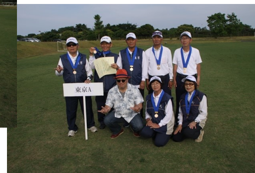
第三位：東京Aチーム