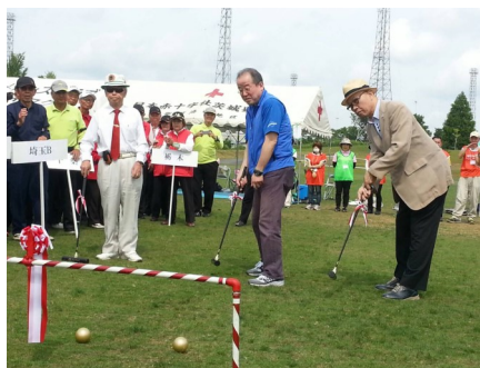
競技開始前の初打式