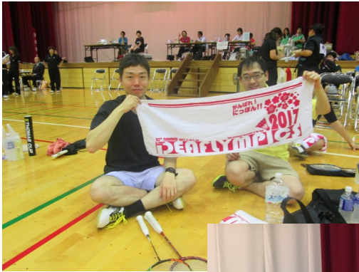
←男子ダブルス優勝ペア