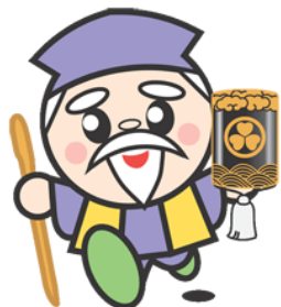
茨城県マスコット ハッスル黄門